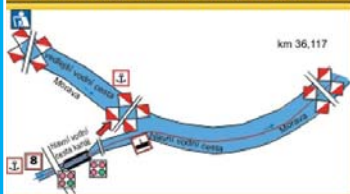
Staré Město u Uherského Hradiště