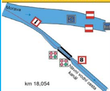
Veselí nad Moravou